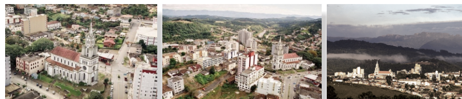
Imagens gerais do Centro Urbano do Município de Orleans.